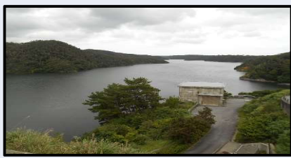
福地ダムの様子(参考: R1.6.21 100%記録時)