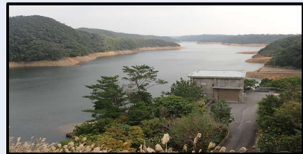
福地ダムの様子(12/31 14時)