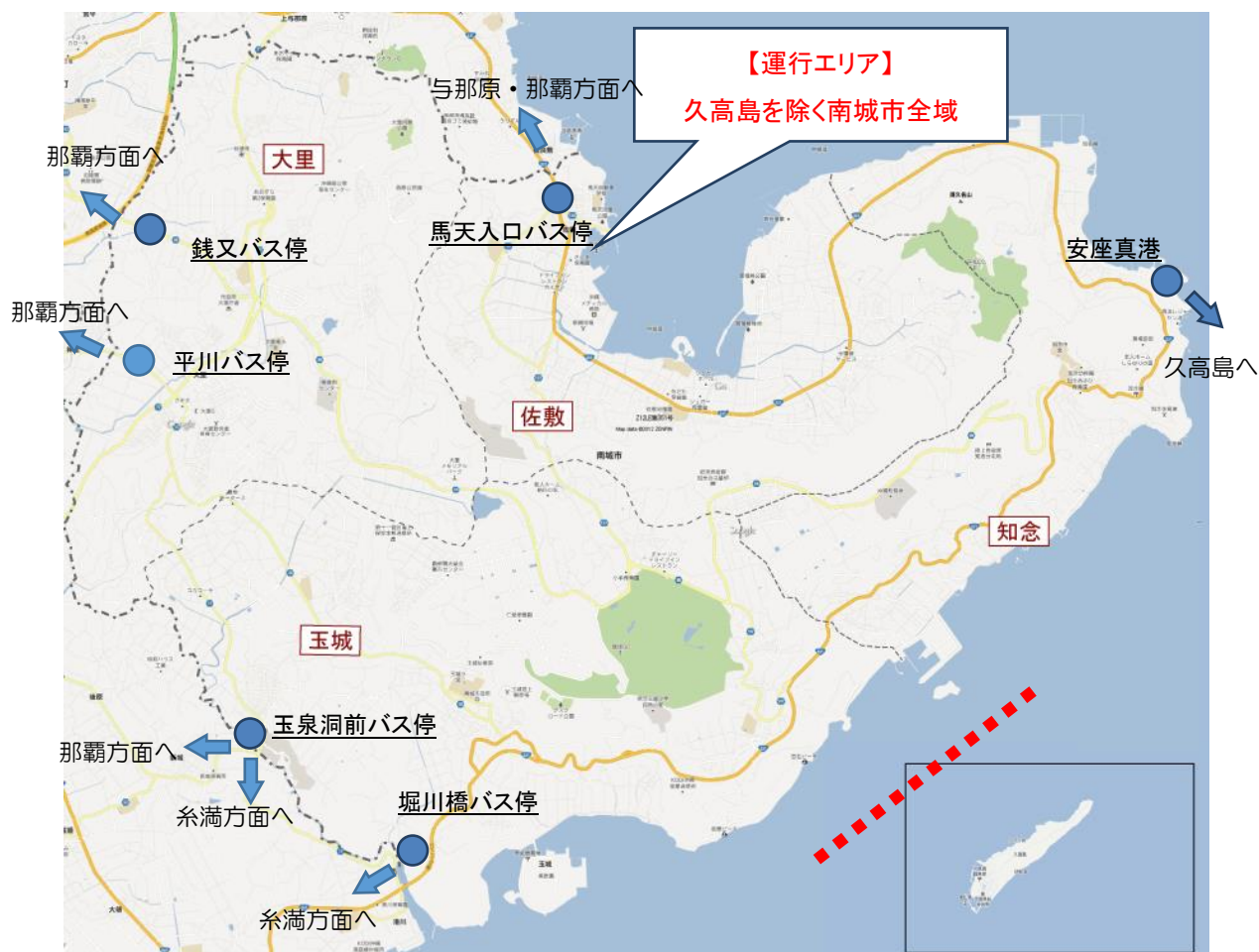
図-1.デマンド交通の運行エリア