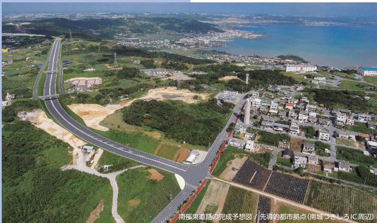
南部東道路の完成予想図 / 先導的都市拠点(南城つきしろIC周辺)