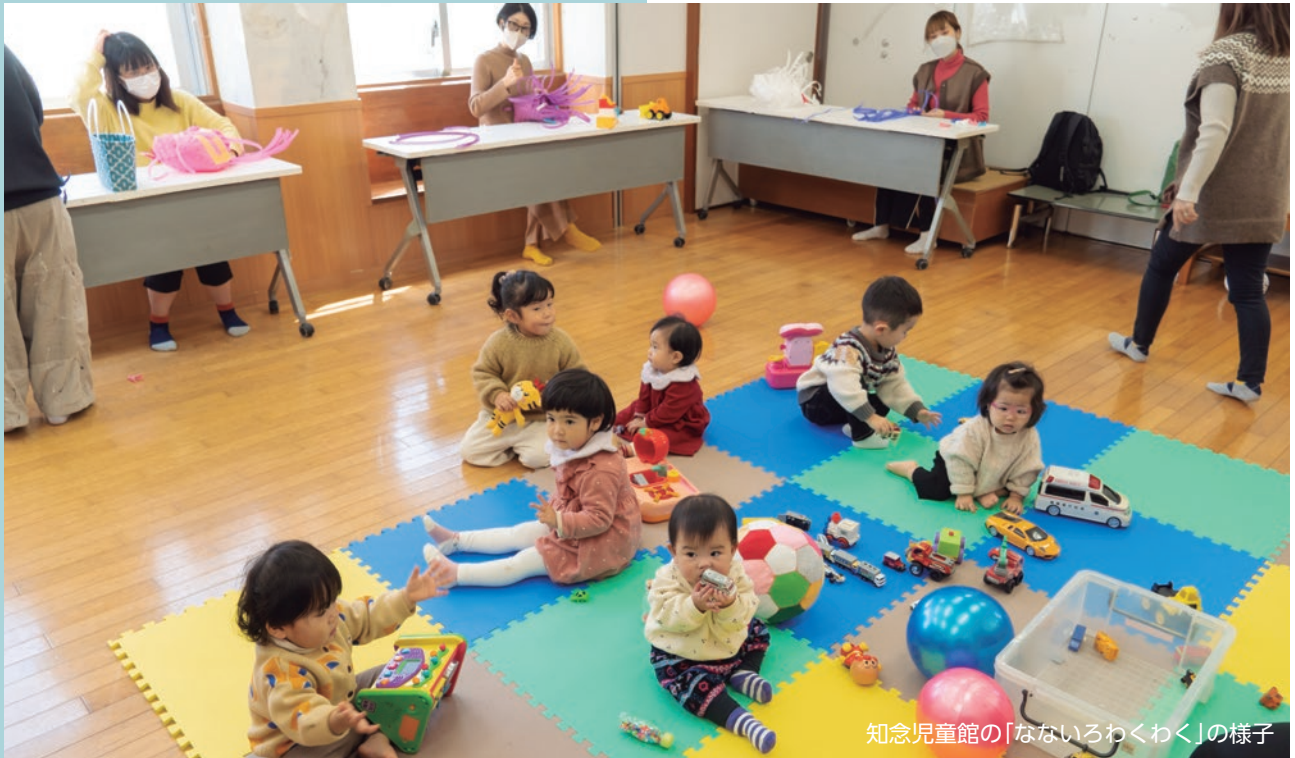
知念児童館の「なないろわくわく」の様子