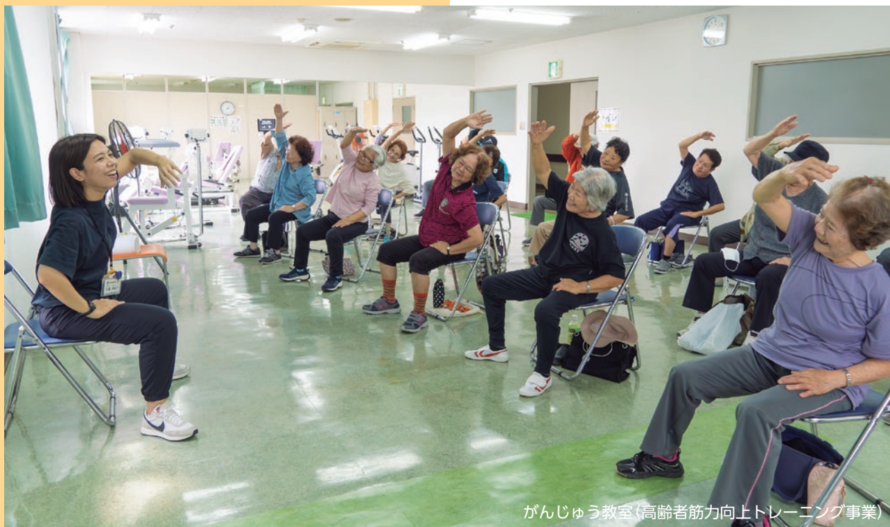
がんじゅう教室(高齢者筋力向上トレーニング事業)