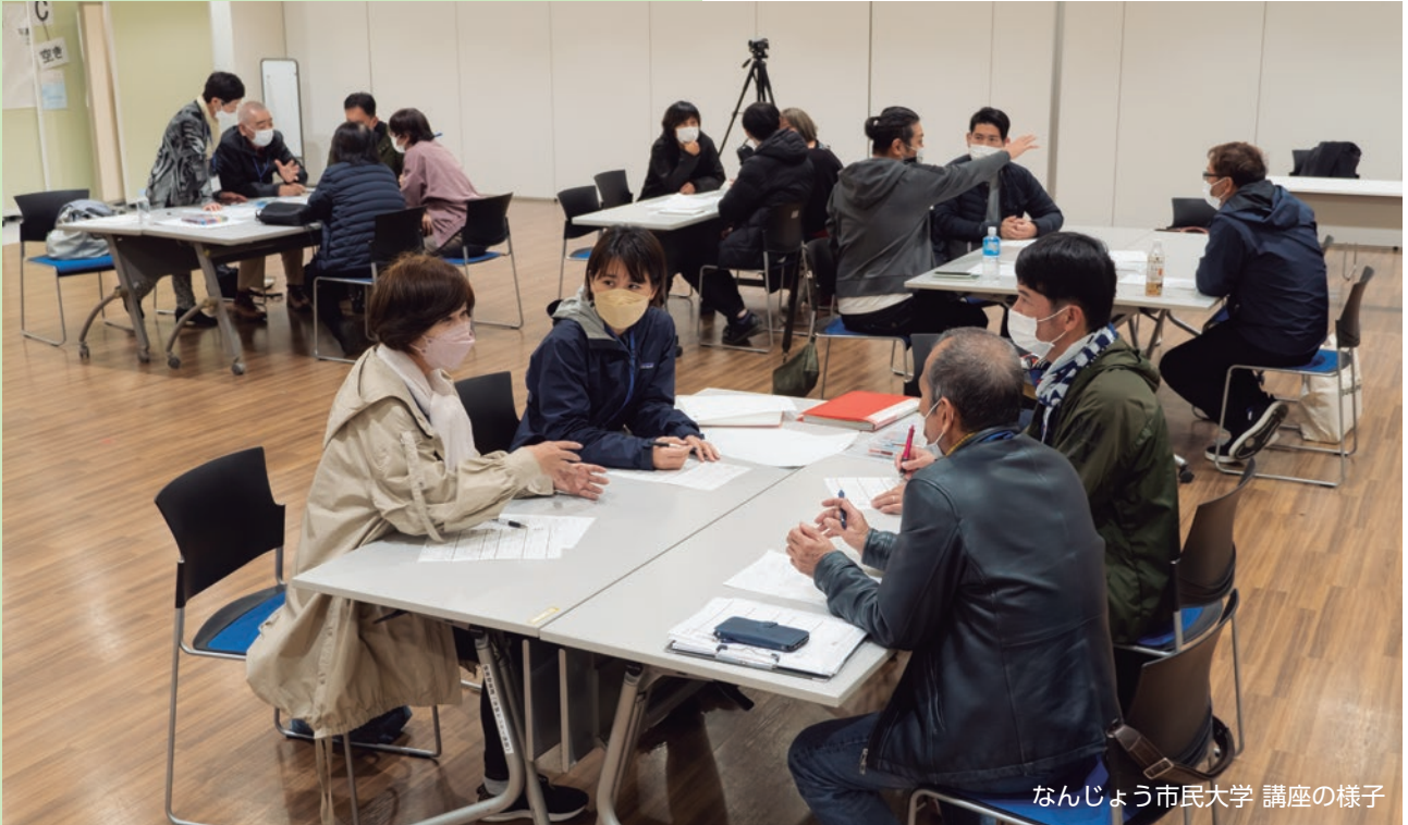
なんじょう市民大学 講座の様子