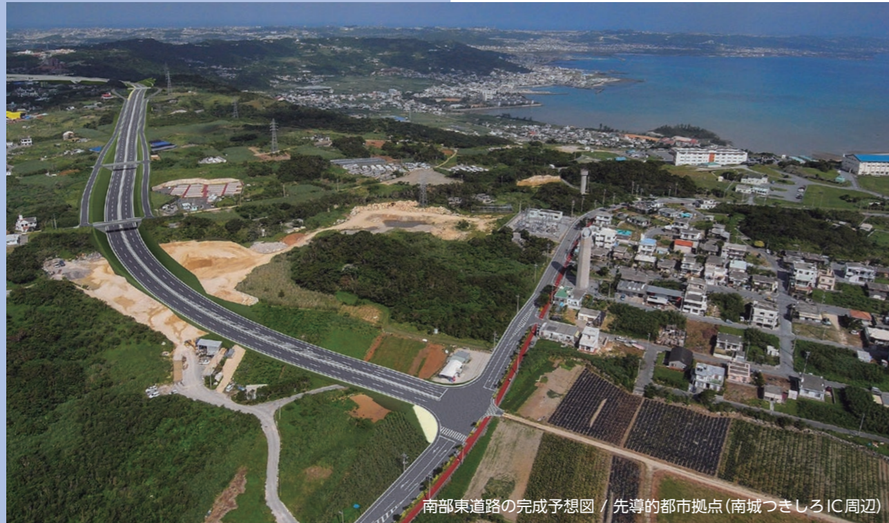
南部東道路の完成予想図 / 先導的都市拠点(南城つきしろIC周辺)