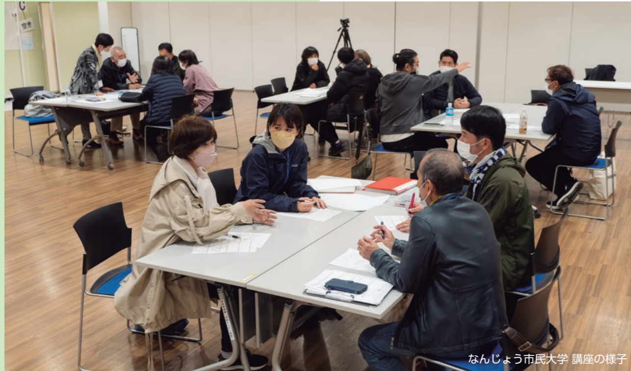
なんじょう市民大学 講座の様子