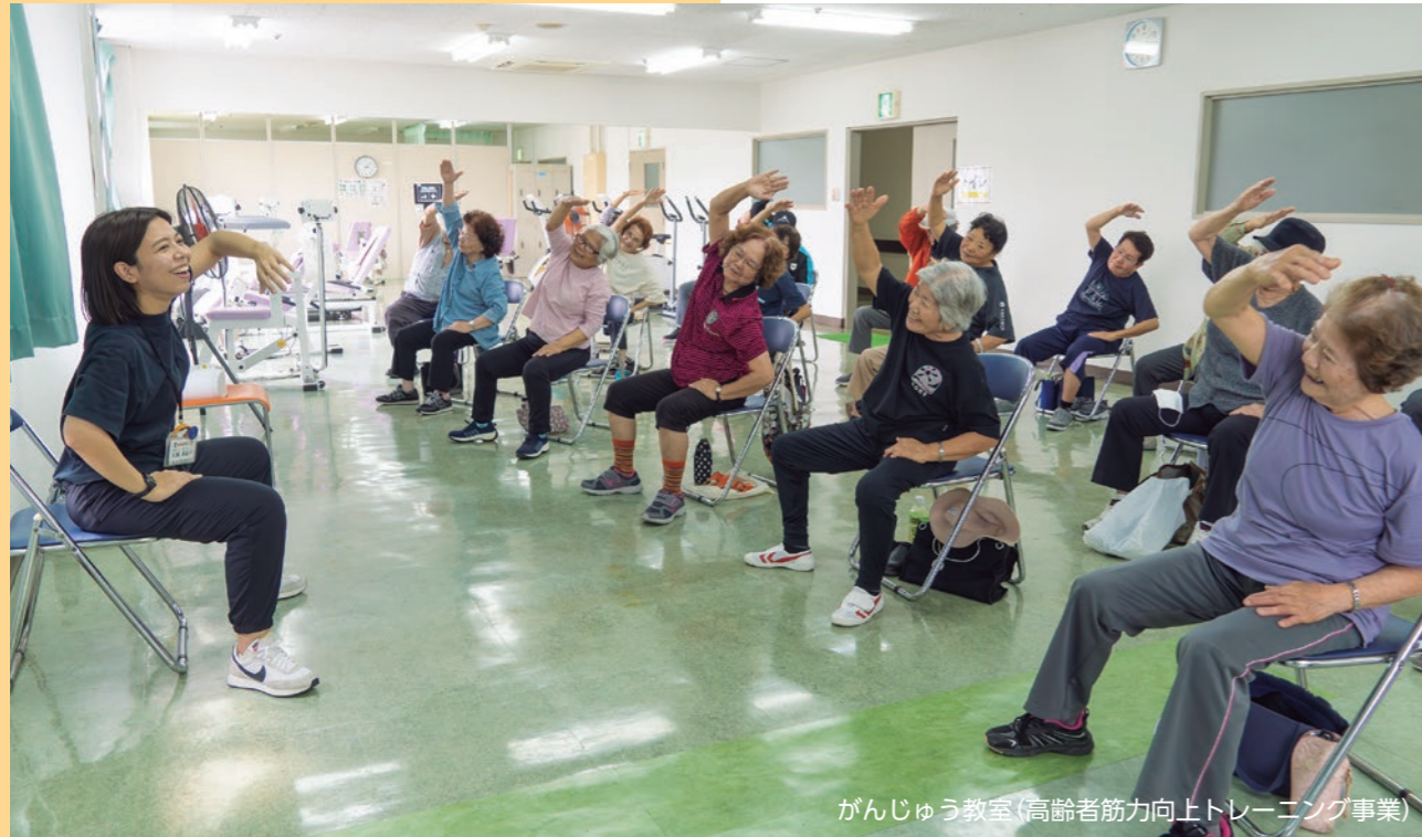
がんじゅう教室(高齢者筋力向上トレーニング事業)