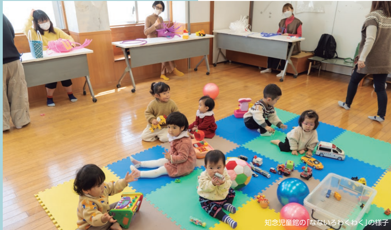
知念児童館の「なないろわくわく」の様子