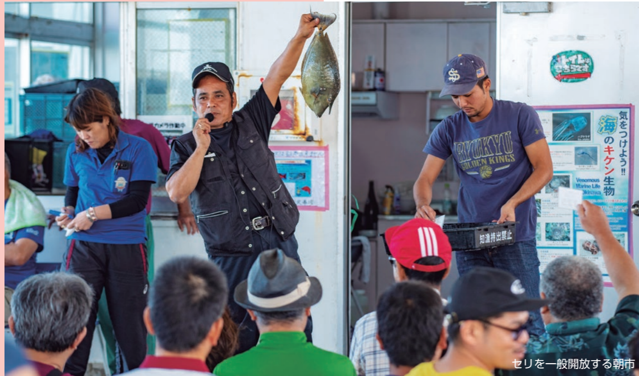
セリを一般開放する朝市