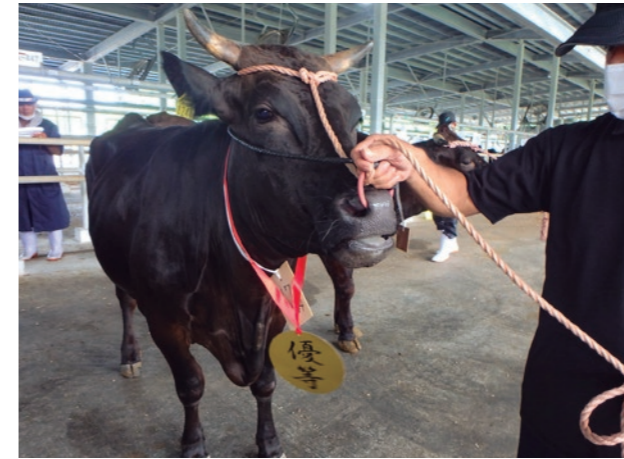
優良繁殖牛・優良乳用牛

品質の良い子牛の安定生産と生産乳量の増加を図るため、優良繁殖牛・優良乳用牛の母牛の導入を推進しています。