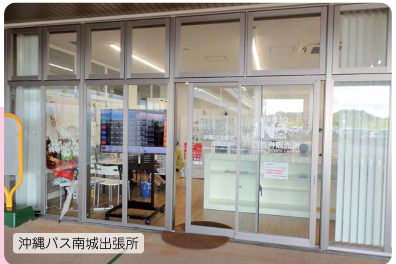
沖縄バス南城出張所

令和元年10月1日～22日の22日間はNバスの無料運行を行い、多くの方に利用していただきました。