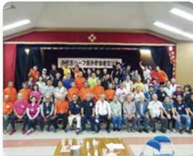
さしき健走会 県外参加者との交流会