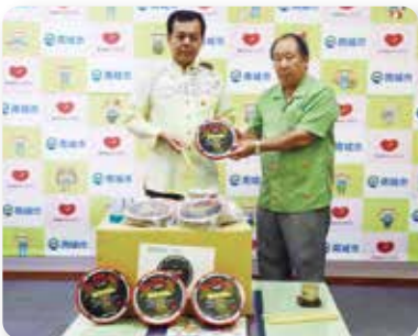
ざまみダンボール 応援パーランクー寄贈