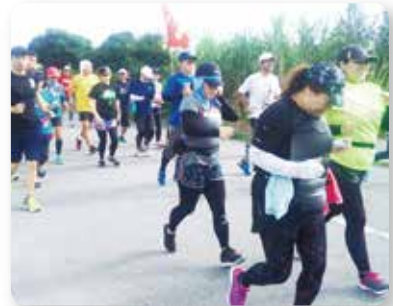
さしき健走会 試走会開催