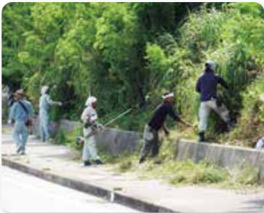
市商工会 コース草刈り