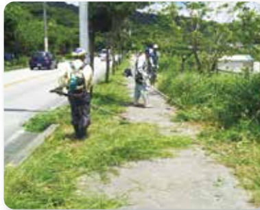
さしき健走会 新里ピラ草刈り