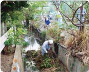
市シルバー人材センター 会場周辺の整備