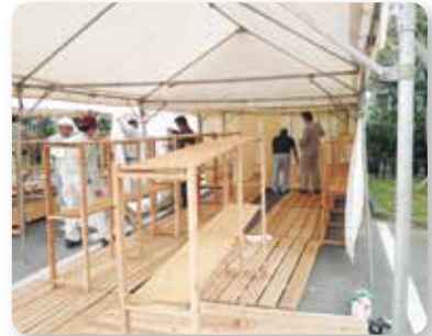
南城市管工事会 シャワー室等の設置