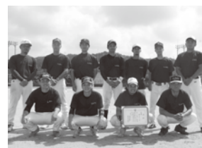
[準優勝]新里チーム