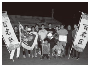
[男子優勝]百名チーム