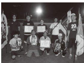
[女子・壮年優勝]津波古チーム