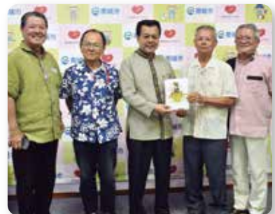
尚巴志倶楽部 ご寄付