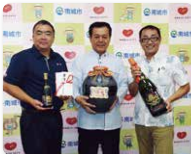
多良川 ご寄付、記念ボトル寄贈