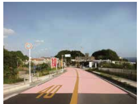
国道カラー舗装・無電柱化イメージ図