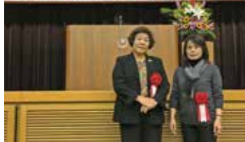
平成28年度 沖縄県統計功績者表彰伝達式 統計グラフコンクール入賞者表彰式

平成28年12月7日、沖縄県庁4階講堂におきまして、統計功績者の表彰伝達式並びに統計グラフコンクールの入賞者表彰式が執り行われ、南城市から2人の統計調査員と、知念小学校4年生の児童が表彰されました。受賞者の皆さま、本当におめでとうございます。