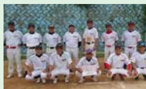
【準優勝】船越チーム