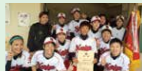
【優勝】ソフトボール女子