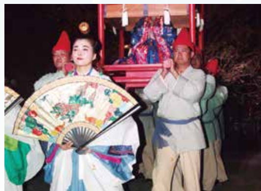
▲ 装束や道具も本格的！