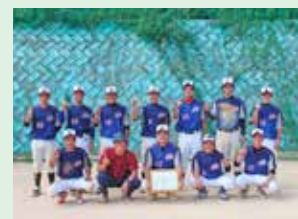
【準優勝】新開チーム