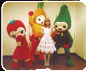
(レイナ姫と野菜の国の仲間たち)