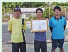
【準優勝】津波古チーム