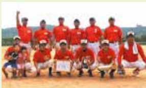
【優勝】津波古チーム