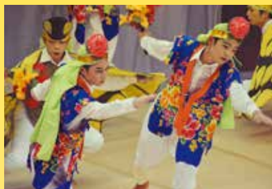
知名青年会による胡蝶の舞