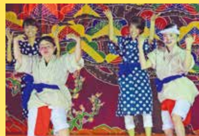
アットホームな雰囲気の久手堅