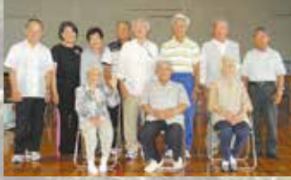
南城市老人クラブ連合会

生きがいづくり、健康づくり、仲間づくり、地域づくり。仲間と共に4つの『づくり』活動を展開している南城市老人クラブ連合会。会員同士や世代間交流を積極的に行い地域に貢献。「いつまでも健康で楽しく、心豊かに」今日も元気に活動します。