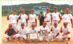
【優勝】志喜屋チーム