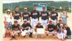
【準優勝】佐敷チーム