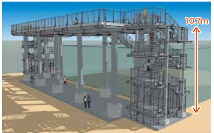
久高地区津波避難施設イメージ図

久高島集落地域で最も高い海拔は14.1メートルです。地震が発生した場合、住民及び観光客が津波から避難する施設が必要なことから、海拔10mの敷地に津波避難施設(防災タワー)を整備し、避難場所の確保を図ります。 (来年2~3月に完成予定)