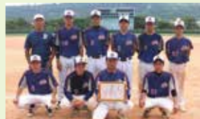
【準優勝】新開チーム