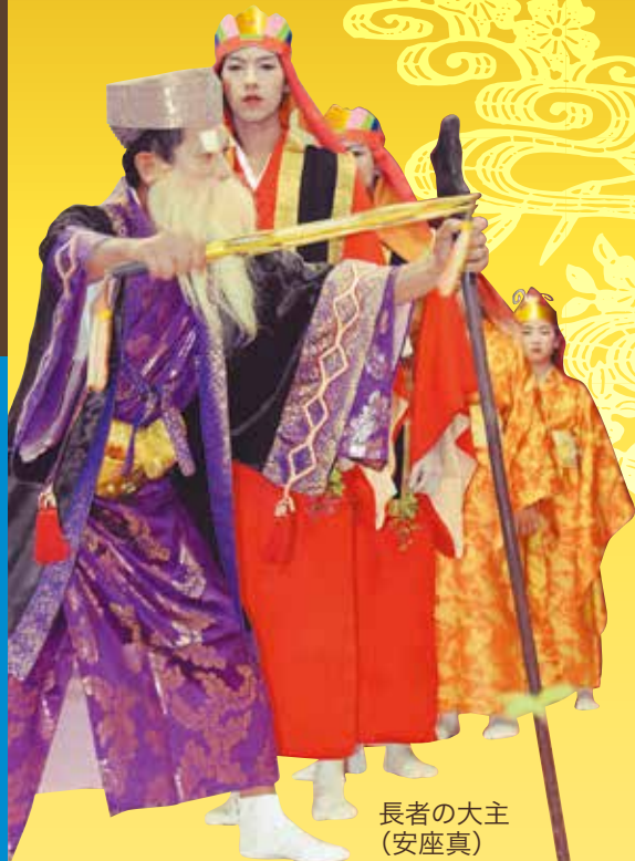
長者の大主 (安座真)

旧暦7月16日にあたる8月29日、五穀豊穡を祈り、無縁仏を慰めてあの世へ帰す伝統行事「ヌーバレー」が知名、久手堅、安座真の3集落で行われました。