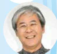
【書き手】 シュガーホール芸術監督 中村 透

で、村の秋祭りの懸賞付き仮装行列へ参加。懸賞に目くらんだらしい母親の演出で、兄弟三人の水戸黄門一行の扮装の