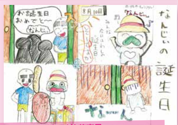
『なんじいの誕生日』銘莉爽風