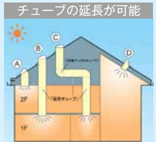
チューブを延長すれば2階を通して1階に採光を得ることも可能です。

【お問合せ】株式会社沖電工 ☎835-9895 FAX 835-0548 E-mail: SLT@okidenko.co.jp