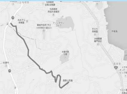
JA北給油所付近～大里城趾公園までの区間