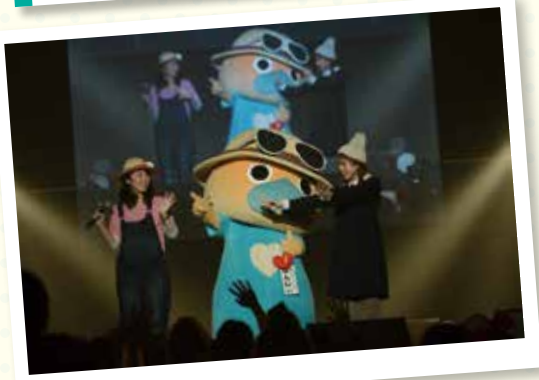
HARAJUKU KAWAii 2013 in OKINAWA でランウェイデビュー☆ 南城市をPRしてきたなん♪