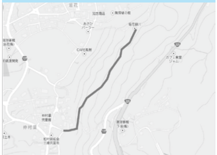
垣花樋川から仲村渠樋川までの区間(遊歩道)

湧き水が年中絶えることなく、下田や志喜屋海岸を見渡しながら散策できる遊歩道です。