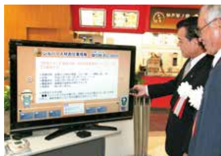
ICT超高齢化社会推進事業サービス開始