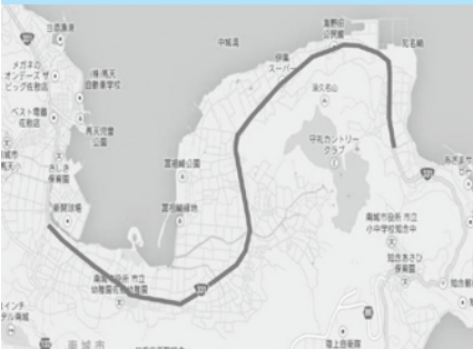
新里交差点(ナカモト前)の国道331号線を知念向けに守礼カントリー入口付近までの区間

南城市知念と佐敷を結ぶ主要道路で、毎日多くの方が行き交います。青い空と、南国情緒あふれるヤシ並木が続く路線です。