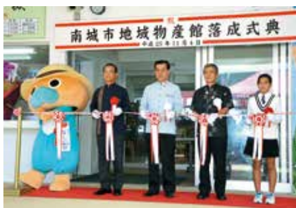
地域物産館オープン