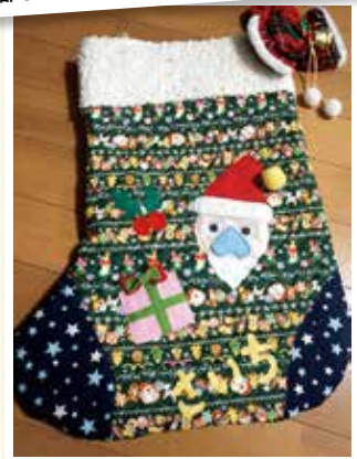
4歳と3歳の息子になんじいサンタ つくりました☆ サンタになっても可愛い(*´ω`*)