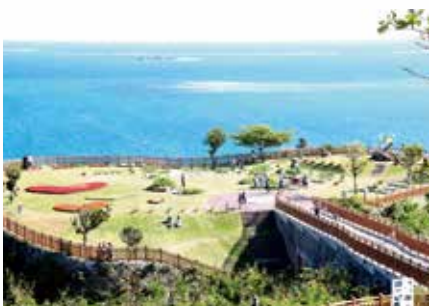
ハーブフェスティバル開催