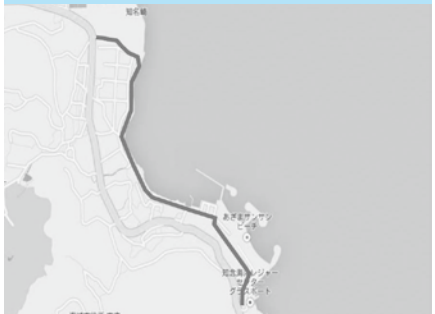
国道331号からあざまサンサンビーチへ向かう坂道からテダ御川までの区間

日の出が眺められ、太陽が一年中サンサンと浴びることができる路線。久高島も見え、景観が素晴らしい場所です。テダ御川やあざまサンサンビーチなどがあります。