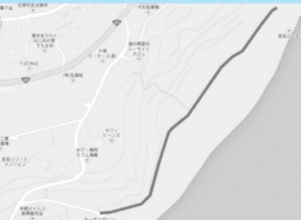
新原バス停留所から浜川御嶽までの区間

受水走水、ヤハラツカサなどこの道沿いには琉球創世神話にまつわる伝説に彩られた史跡が多く存在する路線です。