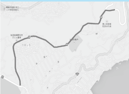
垣花交差点(つきしろ入口)からニライカナイ橋入口までの区間

南城市で一番新しくできた行政区へ向かう路線であり、歩道の植樹帯には年中花が植えられています。ニライカナイ橋までの道でもあり、県内外から多くの方が利用する路線です。