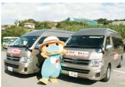
デマンドバス運行開始