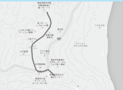
岬公園入口から齋場御嶽までの区間

世界遺産の齋場御嶽があり、毎年多くの観光客が訪れる地です。駐車場の地域物産館から齋場御嶽までの区間は多くの方が利用する路線です。