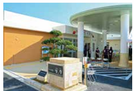
知念児童館・図書館オープン