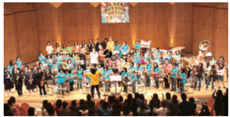
▲BBBBと大里南小、佐敷小、佐敷中、さしきウィンドアンサンブルが共演。

と掛け合い、会場をご機嫌サウンドと包み込みました。 第2部では大里南小学校吹奏楽部と共演し、前日に音合わせをした3曲を披露しました。 最後には佐敷小学校吹奏楽部、佐敷中学校吹奏楽部、さしきウィンドアンサンブルも加わり「聖者の行進」を大合奏。BBBBと南城市内オールスターズの夢の共演に会場は総立ちとなり、ステージと客席が一体となった空間を作り上げました。 BBBBは前日にも地域域出前ステージとして大里アトールなどで演奏。ノリノリの音楽をまき散らし、買い物客を楽しませていました。