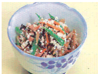
野菜の深みのある味わいを...