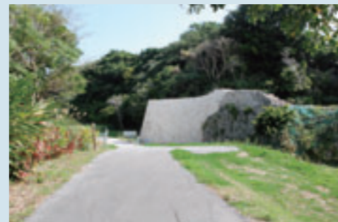
▲クーグスク(奥の林)と石垣