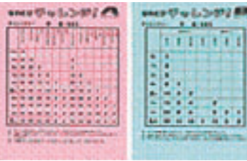
縄跳びチャレンジカード なわとび1級、なわとび名人を 目指してチャレンジ!