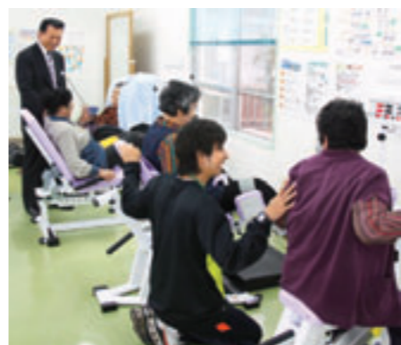
▲指導士が機器利用をアドバイス。利用者に好評！

市では、高齢者の介護予防・健康づくりを目的とした『がんばりゅう教室』を佐敷・玉城・大里・知念・久高の5カ所で実施しています。その施設整備として、油圧式筋力トレーニングマシンを福祉センター（玉城地区）、知念児童屋内体育館、総合保健福祉センター（大里地区）へ3台ずつ新たに設置し、今回で全地区に充実した機器が揃いました。『がんばりゅう教室』には、健康運動指導士が派遣され、高齢者へ油圧式筋力トレーニングマシンの利用方法の指導・助言等も行われます。市民の皆さん、『がんばりゅう教室』に参加して日本一元気な魅力ある南城市を目指しましょう！