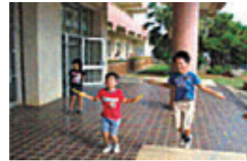
縄跳び運動の奨励 休み時間に縄跳びをして 楽しむ子供たち