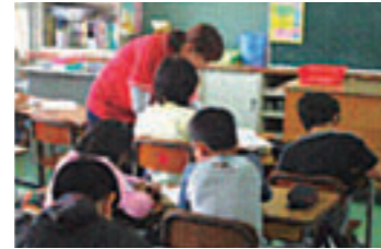
補習指導 全職員による夏休みの 4年生への補習指導