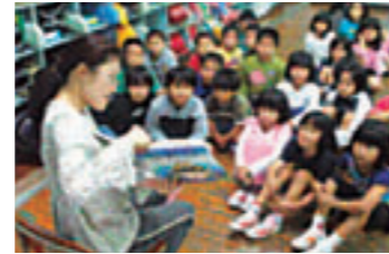
父母による読み聞かせ 毎週火曜日に実施 熱心に読み聞かせを聞く子供たち