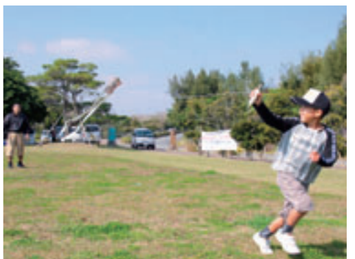
▲風がなければ、走って風をつくるのです！

大里グリーンタウン自治会・青少年コミュニティ広場の企画として「親子たこづくり・たこ揚げ大会」が行われました。 午前中は公民館でたこづくり。竹ひごで骨をつくり、ちらしを貼り付けます。指先を使った作業も親といっしょに刃物を使った作業も親といっしょに安全に経験してもらうことも今回の狙いです。意外と大人たちが夢中。 午後からは玉城グスクロード公園でたこ揚げ！ 残念ながらあまり風が吹いていませんでしたが、子どもたちは元気に走り回りながらたこを揚げていました。