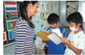
英語活動 楽しいコミュニケーションの 素地づくり