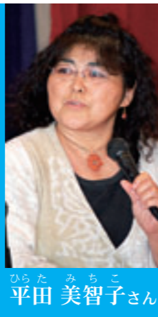
津波古11班出身。といち会、劇団賞味期限などに加入。自ら開設した多目的空間を拠点に、地域を巻き込んだイベントを展開。