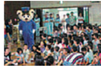
不審者対策 与那原警察署による講演会