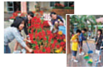
元気に朝の清掃活動 早登校し、元気に校庭の 清掃をする子供たち