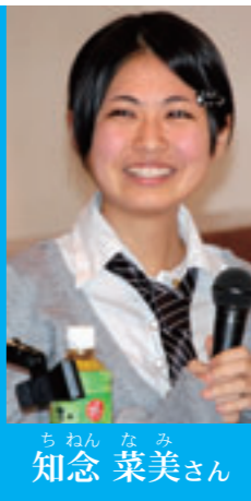
南部商業高校2年。マーケティング部プロジェクトリーダー。久高島の塩を使ったちんすこうを開発。知念出身。