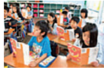
授業始めの音読 授業改善に向けての 共通実践項目の取組