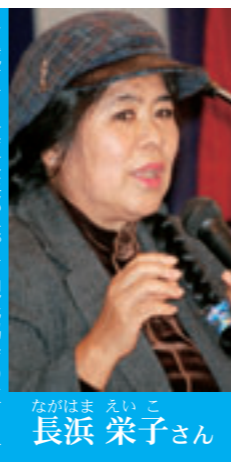
南城市商工会女性部長。市観光協会の立ち上げや大里フラダンスサークルなどの活動を行っている。

会はこのスタートじゃないかと。こういう場を期して新しい市を作っていくことになると思っています。