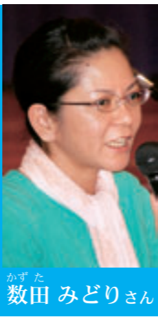
3人の仲間と手づくり市「ゆんたく庭」を立ち上げ、地域づくりのあり方を模索中。玉城でタイ雑貨の店を経営。

ゆんたく庭という庭に集まって手仕事を紹介して、それを見た人たちが刺激を受けて、というサイクルをつくりたい。ぜひ「私はこれだったら協力できるよ」という方は私たちにこそ一報頂ければ。