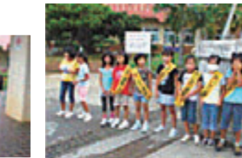
朝のあいさつ運動 校門前でのあいさつ運動