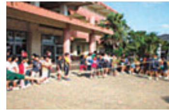
児童会活動 にこにこふれあいタイム 兄弟学級で遊ぶ子供たち