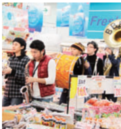
▲大里アトール店内をパレード。

と掛け合い、会場をご機嫌サウンドと包み込みました。 第2部では大里南小学校吹奏楽部と共演し、前日に音合わせをした3曲を披露しました。 最後には佐敷小学校吹奏楽部、佐敷中学校吹奏楽部、さしきウィンドアンサンブルも加わり「聖者の行進」を大合奏。BBBBと南城市内オールスターズの夢の共演に会場は総立ちとなり、ステージと客席が一体となった空間を作り上げました。 BBBBは前日にも地域域出前ステージとして大里アトールなどで演奏。ノリノリの音楽をまき散らし、買い物客を楽しませていました。