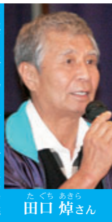
南城市ノルディックウォーキング同好会会長。津波古区健康づくり推進員、音訳ボランティア、文化財ガイドなど幅広く活動。