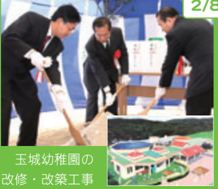
玉城幼稚園の改修・改築工事安全祈願祭が、同幼稚園敷地内で行われました。

新しくなる玉城幼稚園には船越幼稚園と百名幼稚園が統合されることになっており、専任園長が配置されるほか、2カ年保育、完全給食、保育時間の延長など幼稚園教育の充実が図られます。