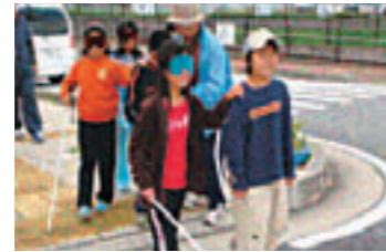
体験活動 3年生のゆいハートでの 福祉体験