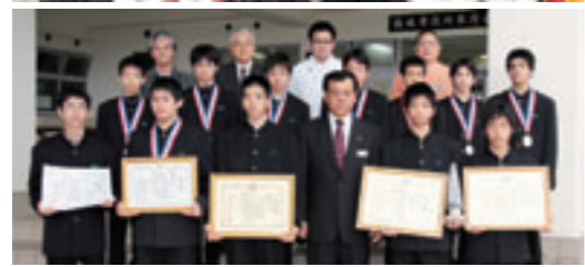
▲報告に市長室を訪れたソフトボール部（上）、卓球部と科学作品展の受賞者（下）

またこの日は沖縄青少年科学作品展（沖縄電力主催）の受賞報告も。沖縄県知事賞、沖縄電力社長賞ほか佳作2点を受賞し、その実績を讃え学校奨励賞も受けています。古謝市長は「指導者や家族への感謝を忘れずに、さらに大きな目標へと精進して」とエールを送りました。