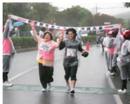
▲視覚障がい者と晴眼者、協力しあって二人でゴール！