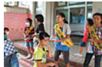
あいさついっぱい110作戦!! あいさついっぱい110作戦