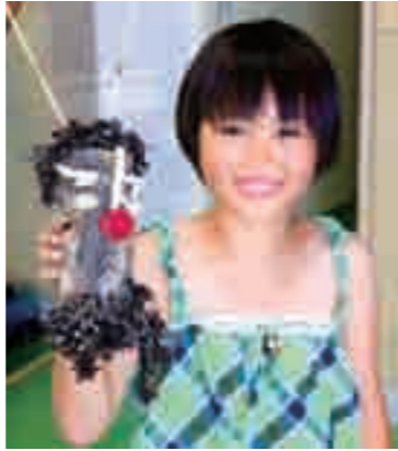
▲やさしい鬼さんを作りました！

あざまサンサンビーチ内にある海 の館・イノーでエコクラフト体験が 行なわれました。貝がらや海への漂 着物を使ったもの。中には流木をの こぎりで切ったり、ドリルで穴をあ けるほどの大作も。初めて体験した 子は「楽しかった！貝がらをくっ つけるのが難しかった」と、作品を 手ににっこり。