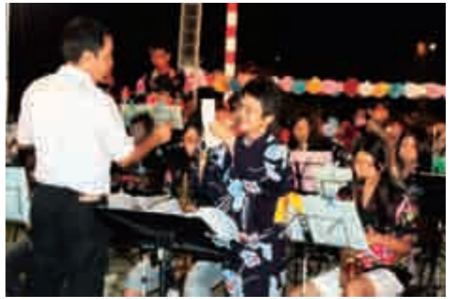
▲かなり贅沢な企画！市民が生演奏で歌う「生オケ」も。