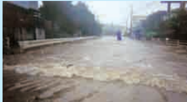
平成19年7月13日台風第4号による高潮で冠水した名護市安部の道路