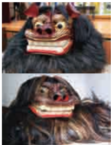
▲新(上)と旧(下)を比べてみよう

獅子舞で有名な稲嶺区では新しい 獅子が初登場。これまでは各地の行 事で演舞依頼があると、一体しかな い守り神である獅子が持ち出され、 地区内に不在になることも。不安を 感じる住民もいたことから2体目を 制作。今後は交流獅子として、稲嶺 区外の演舞で活躍することになりま す。