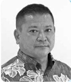
め かる てつ じ 銘 莉 哲 次