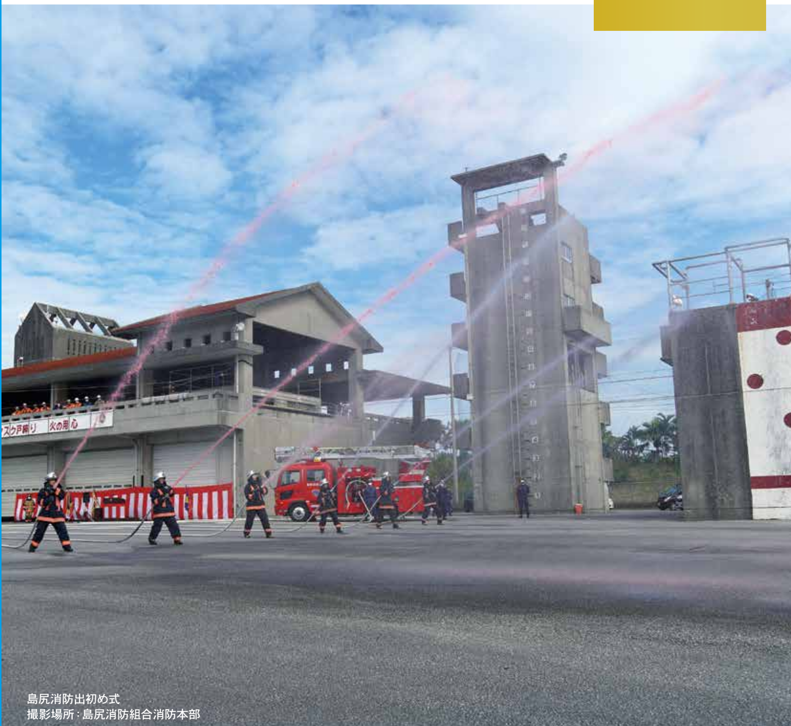
島尻消防出初め式 撮影場所・島尻消防組合消防本部