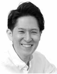
ちょうふう ずけらん長風