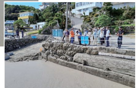
知念海洋レジャーセンター