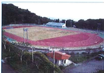
南城市陸上競技場