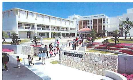
南城市立大里南小学校