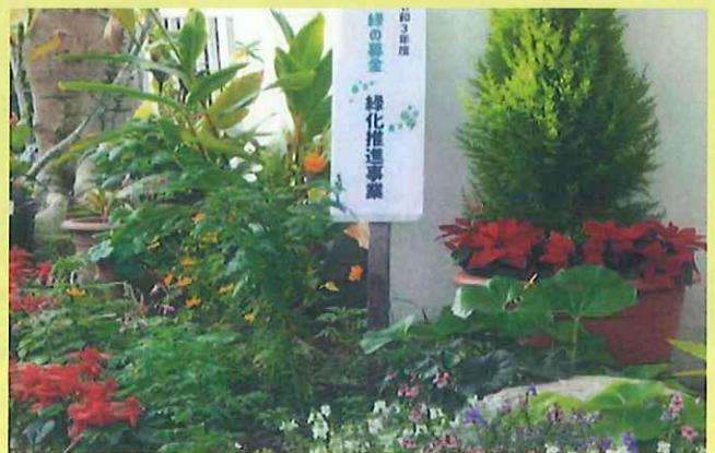
地域緑化活動（北谷町）