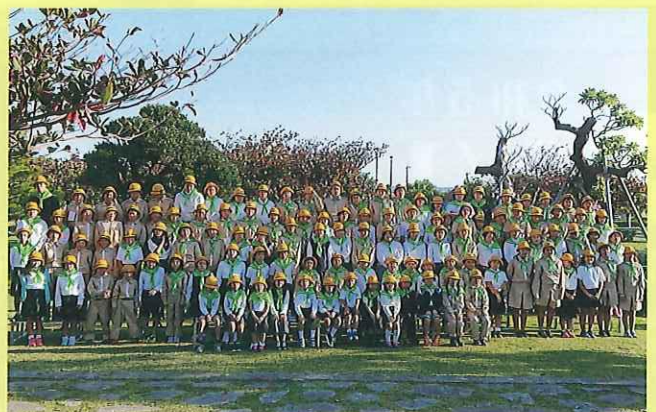
緑の少年団の育成