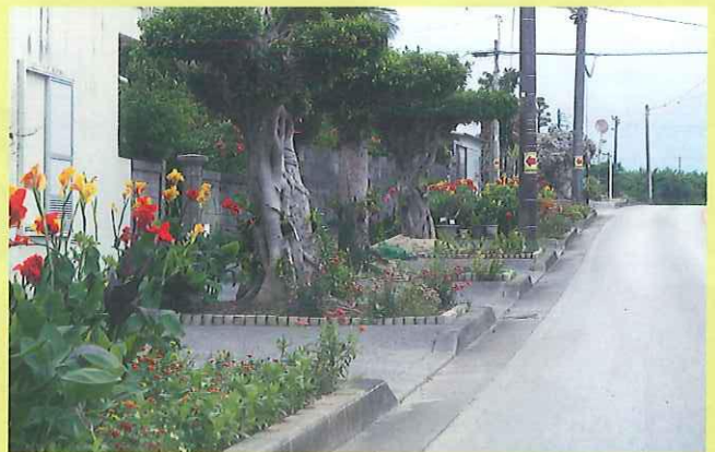
地域緑化活動（糸満市）