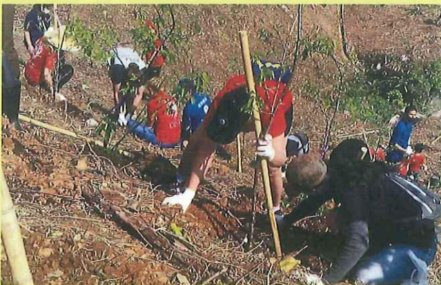
地域緑化活動（恩納村）