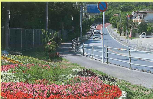
地域緑化活動（南城市）