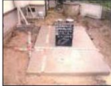
●上部スラブコンクリートの状況