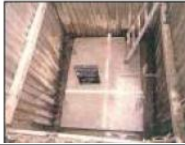
●底版コンクリートの打設状況