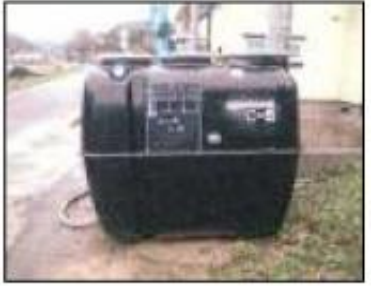
●浄化槽本体の搬入と確認