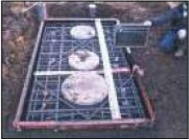
●上部スラブの配筋