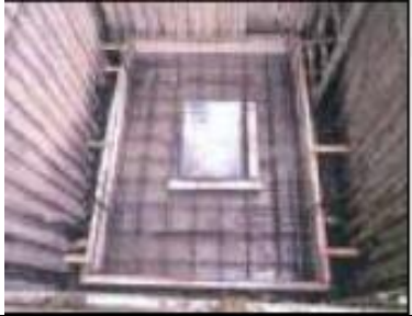
●底版コンクリートの配筋状況