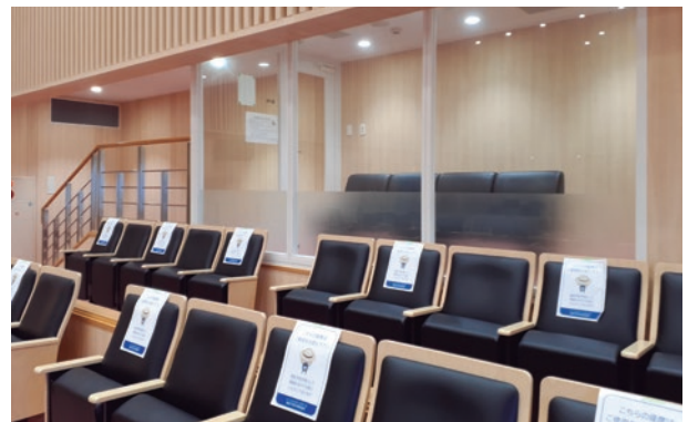
議場内の傍聴席と親子席

Council: the Nanjo City Council consists of 20 members. The city council deliberates and proposes municipal policies, budgets and ordinances at plenary meetings and at meetings of the General Affairs and Welfare Committee and the Industry and Education Committee.