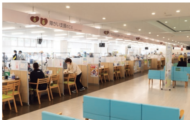
南城市役所 1階窓口

Administration: in order to provide efficient and quality public services, the government is promoting human resource development for administrative staff, outsourcing some tasks to the private sector and putting administrative procedures online.