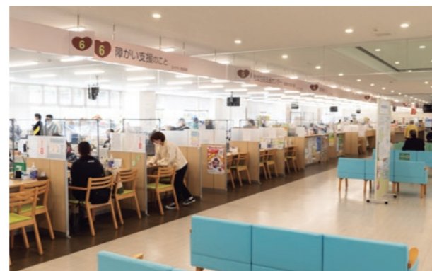
南城市役所 1階窓口