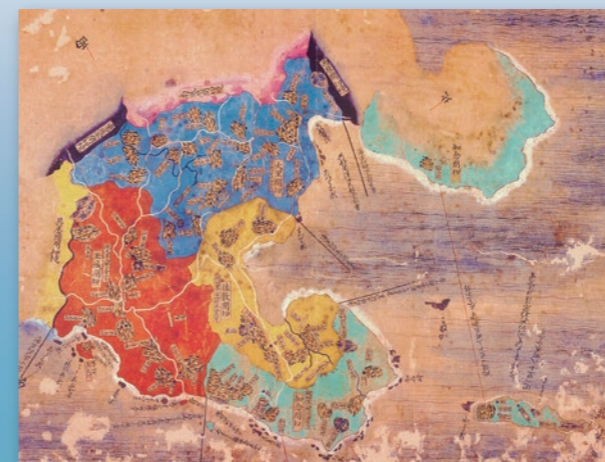
国指定重要文化財「間切図」より

本市勢要覧を通じて、本市における地域資源の豊かさ、産業のポテンシャル、市民の活力などをご覧いただき、人と自然が調和した田園文化都市に向けた歩みを感じていただければ幸いです。