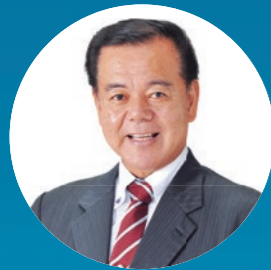
南城市長 古謝景春