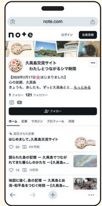
久高島交流サイト (note) 「わたしとつながるシマ時間」 https://note.com/fit_eel1041