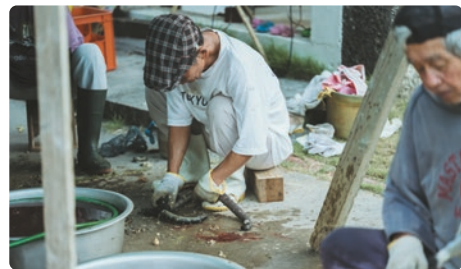
継承される島の営み：イラブー(海蛇)の燻製

久高島は、関わるほどに豊かさを感じられ、日々の暮らしの中に生きる知恵があふれている場所だと感じています。少しでも気になった方は、交流サイトやInstagramをのぞいてみてください。そして、「関わってみたい」と感じていただけたなら、その一歩を踏み出してもらえたら嬉しいです。