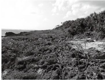
カペール東側の植物群落