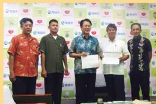
▲ 5月29日、市商工会建設部会との「災害時の対応に関する協定」調印式。