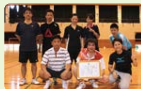
【準優勝】大里グリーンタウンチーム