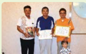
【団体優勝】大里グリーンタウン