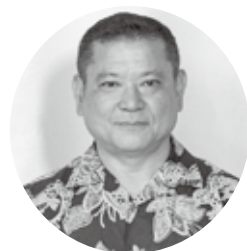
め かる てつ じ 銘 刘 哲 次