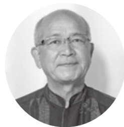
あ だ に や ただし 安谷屋 正