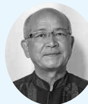
南城市議会議長 安谷屋 正