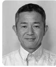
なか むら さとし 中村 哲