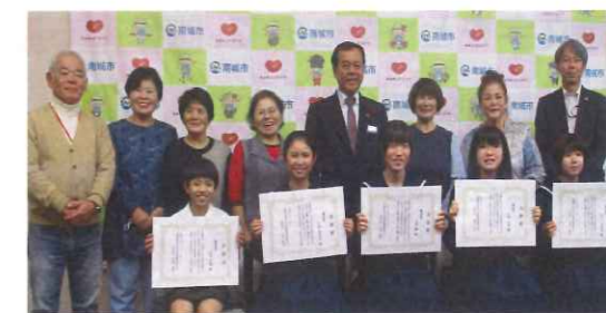
表彰式(推進委員、受賞者の皆様)

「男女共同参画について、日々の生活の中で感じる事、心掛きたい事、希望すること」をテーマに標語を募集。203句の応募があり、推進委員による選考、輝きフェスタの来場者による投票により、優秀作品が選ばれました。来場者から「素直な言葉に溢れていた。」「中学生ながら素晴らしい着目。感心しました」との感想が寄せられました。