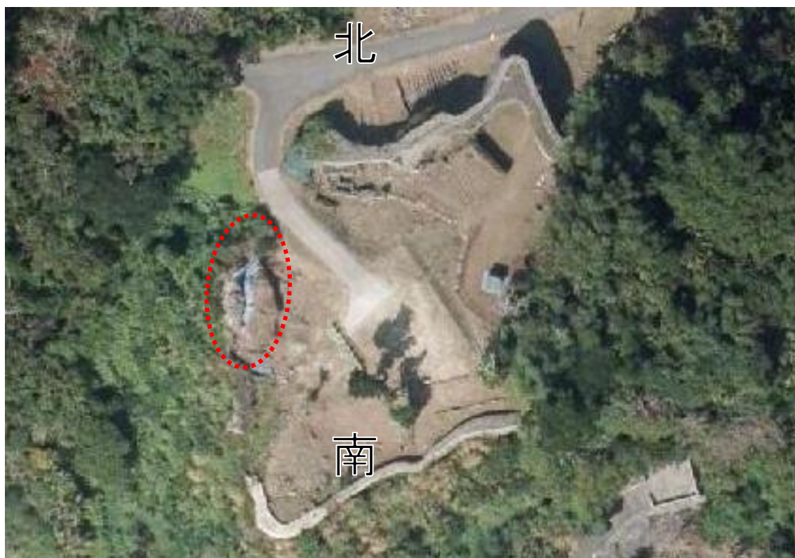
写真① 写真測量箇所（航空写真）