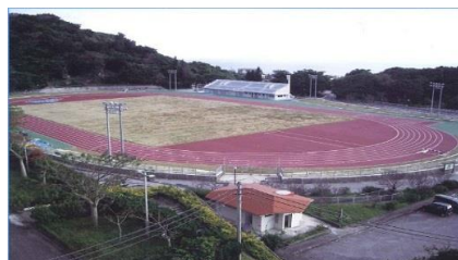
南城市陸上競技場