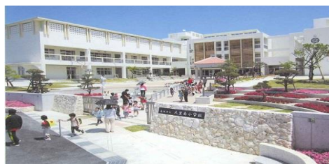
南城市立大里南小学校