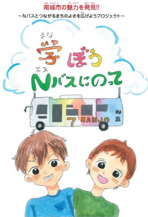
原作・絵：南城市立佐敷小学校6年2組(令和6年度卒業) 企画・編集：南城市企画部交通政策課

令和6年度に佐敷小学校6年生がMM教育の授業実施を踏まえ作成した絵本の読み聞かせを、低学年向けに実施する。自分たちが経験した楽しかったことや失敗などが記載されているため、MM教育の導入として取り入れ、Nバス(公共交通)に乗った際のマナー等を絵本を通して伝えていく。