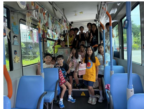
▲令和7年飾りつけをしたNバス車両