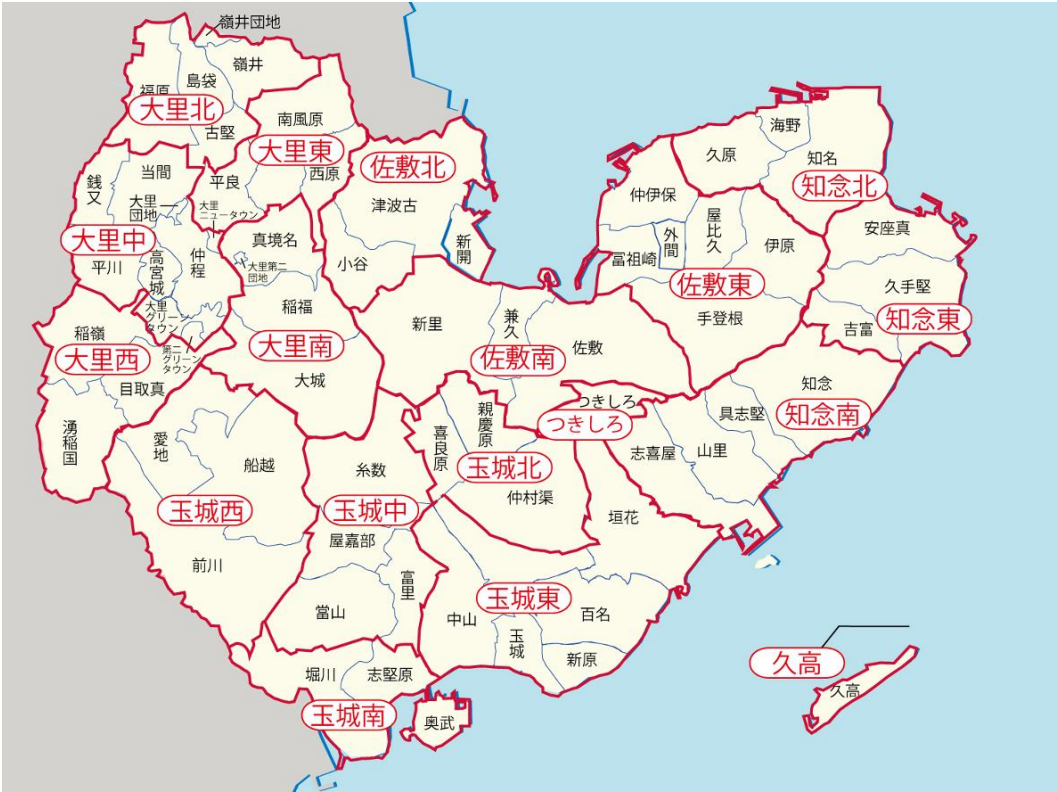
図-1. 市内の地区分け(案)