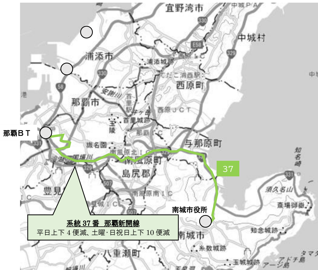
表 1.系統 37 番の便数の見直し(便数は上下の合計)

また、系統 38 番については、路上駐車車両により通行に支障をきたしている志喜屋集落内の通行を取り止め、国道 331 号経由に変更します。