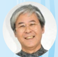
【書き手】 シュガーホール芸術監督 中村 透

おもしろいことを発見しました。学校の教室を訪れた見知らぬ大人をわりと自然体で受け入れ共同行動できる子どもたちと、なかなか心が開けずについて、行動するのにかなり時間のかかる子どもたちとがいることです。おもしろいというのは、この差が、子ども個々の差というよりは、子どもたちの暮らす地域によって、歴然と違うようにみえることです。ノリのよい前者は知念・大里の子どもたち、慎重派の後者は佐敷・玉城の子どもたちです。