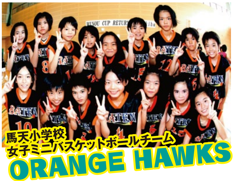
馬天小学校 女子ミニバスケットボールチーム ORANGE HAWKS

8月17日・18日に福岡県うきは市で行われた『第12回 みのうカップ』に県代表として出場し、九州各県から出場した24チーム中5位の成績を残しました。来年は是非優勝してほしいですね。